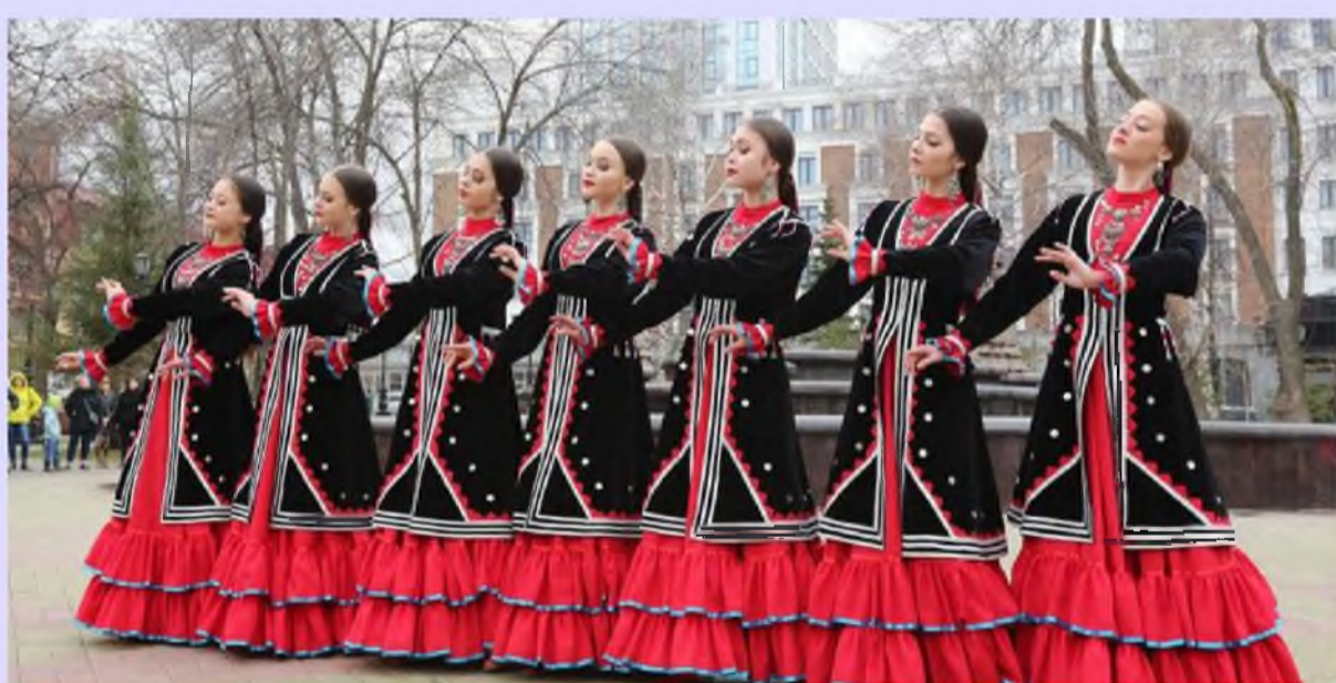
Костюмы "Семь девушек" на сумму 390 000 рублей