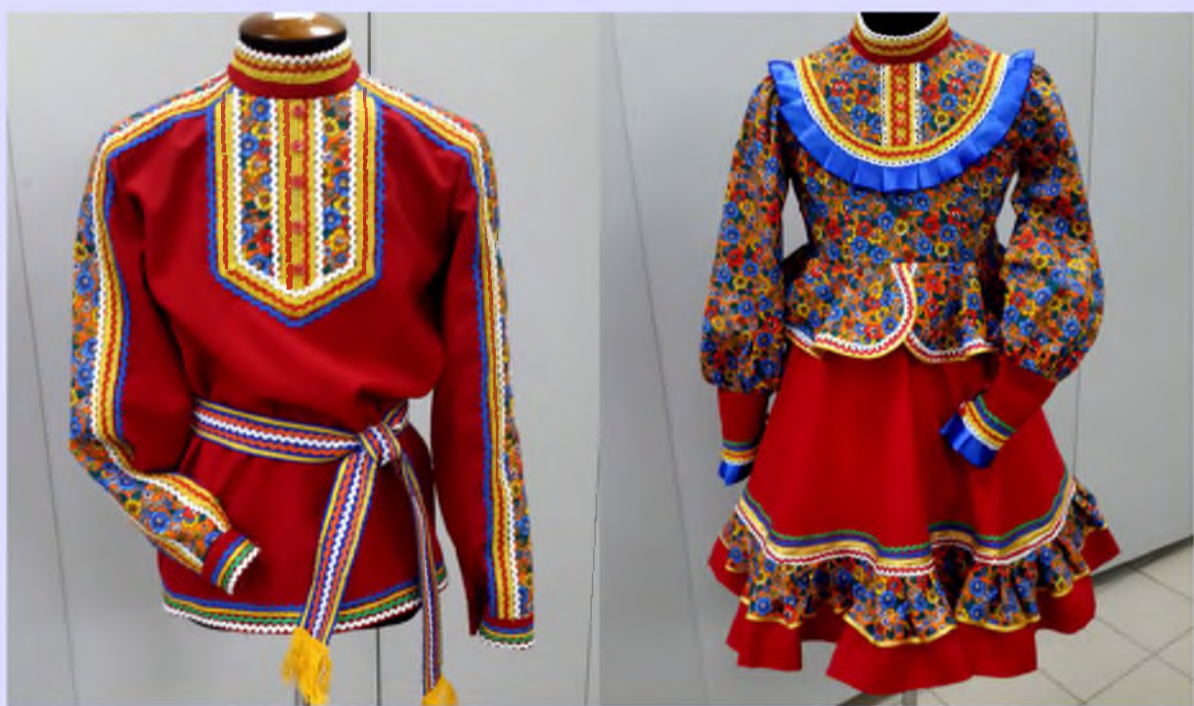
Русские народные костюмы "Кадриль" на сумму 63 000 рублей

Новые костюмы для постановки танцевальных номеров для образцового ансамбля "Толпар"