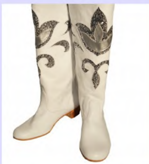
Сапоги для девочек и мальчиков 70 000 рублей